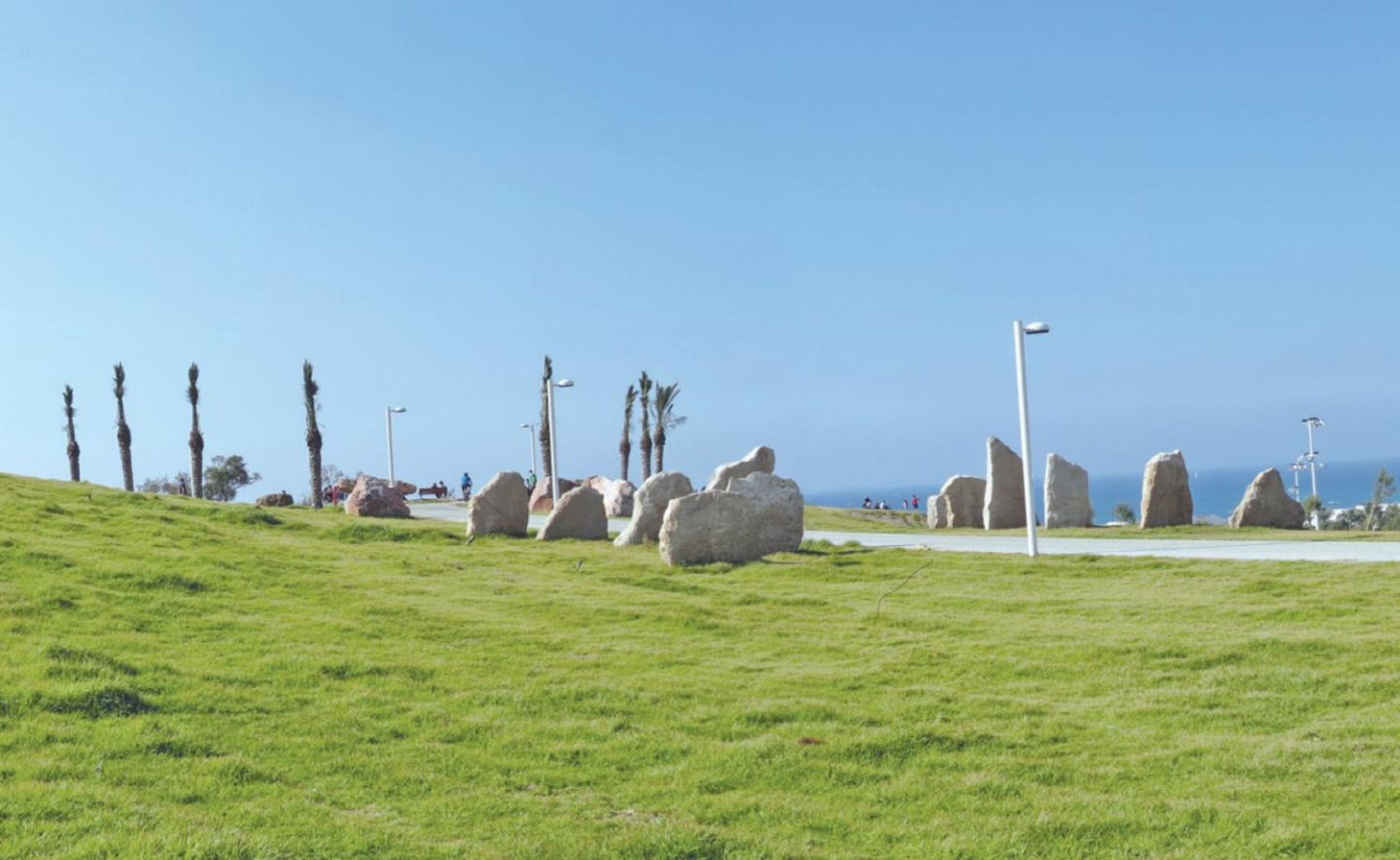
הטיילת וגבעת הסלעים