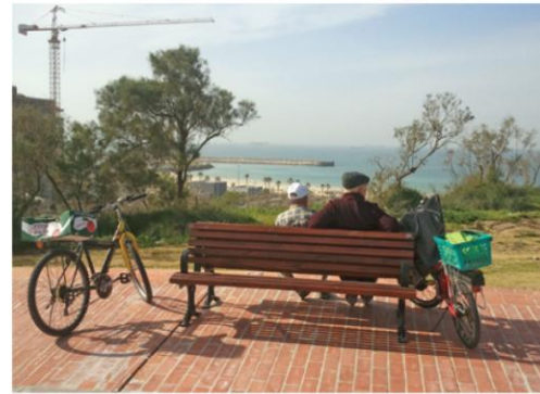
מימין לשמאל: האדם, השמים והים; האדם והעיר; חווית המרחב מתצפית

ההשפעה ואף גבולות הפיזיים של הפרויקט, יוצר דיפוזיית מרכיבים עירוניים, מחייב לראות את הפרויקט כחלק ממספר רב של מעגלים ורצפים. מגמה זו מאפשרת את יצירת הפארק כאיבר חי ומשמעותי בגוף העיר.