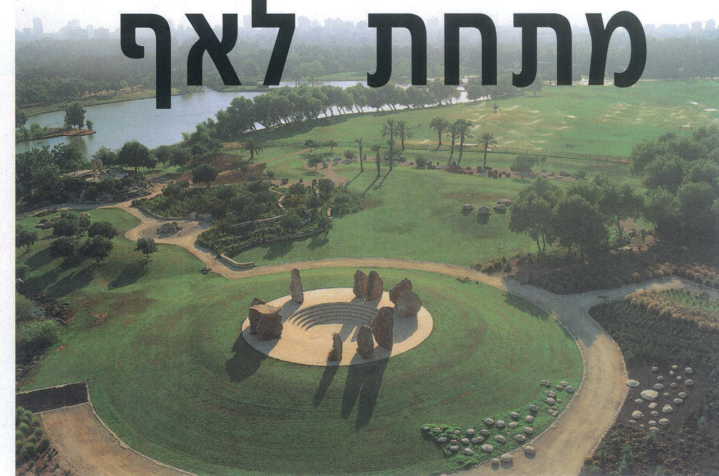
גן הסלעים. חלק ממרחבי הדשא הגדולים

לפעמים אנו שוכחים מה ממתין לנו ממש מתחת לאף, ולעיתים לא צריך לנסוע רחוק על מנת לחוות נופי טבע ירוקים. בפארק הגדול במדינה, המשתרע על שטח של 3,500 דונמים, ניתן למצוא אטרקציות רבות שבהן כל אחד יכול למצוא עניין - מרחבי דשא עצומים, מתקני ספורט וחדרי כושר פתוחים תחת כיפת השמים, מתקני מים וגנים ייחודיים ומפתיעים.