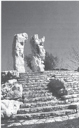
גן הסלעים במארק היקון בתל אביב