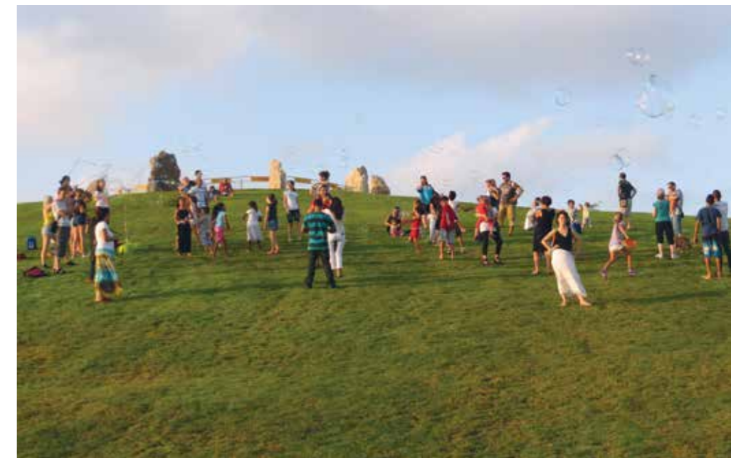
▲ מקום עם נקודת מבט שונה - פארק אשדוד.

שגרתית שהפכה לשביל טבעת של הגן, תאורה צבעונית שמרעננת ומדגישה את החידוש ואף יוצרת תפאורה ועניין למבוגרים ולנוער. אלמנט מרחבי שמייחד את הגן, מייצר מקום מיוחד וממתג את השכונה.