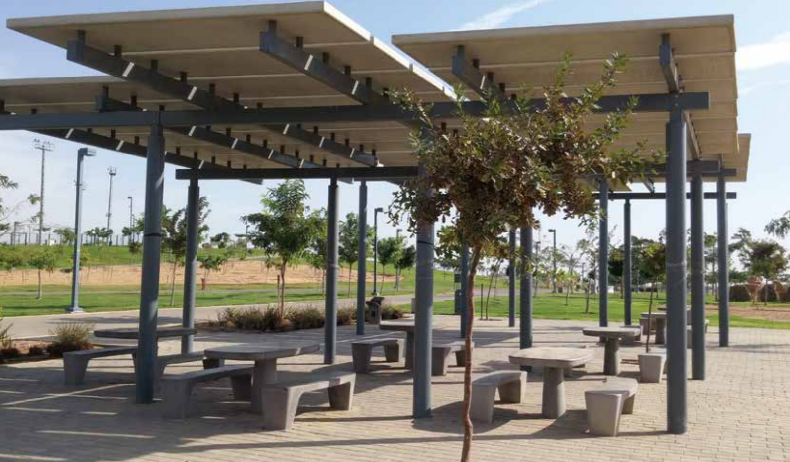
▲ מערכת הצללה - פארק נחל באר שבע.