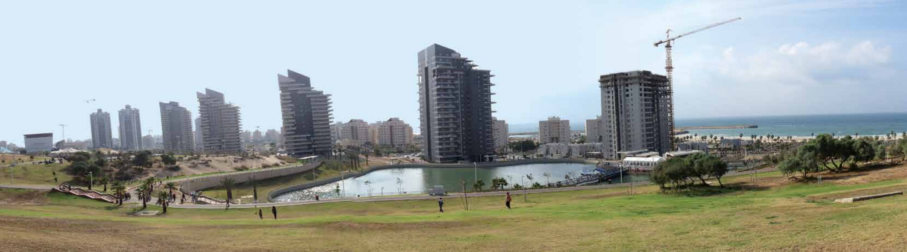
▲ מראה פנורמי - פארק אשדוד.