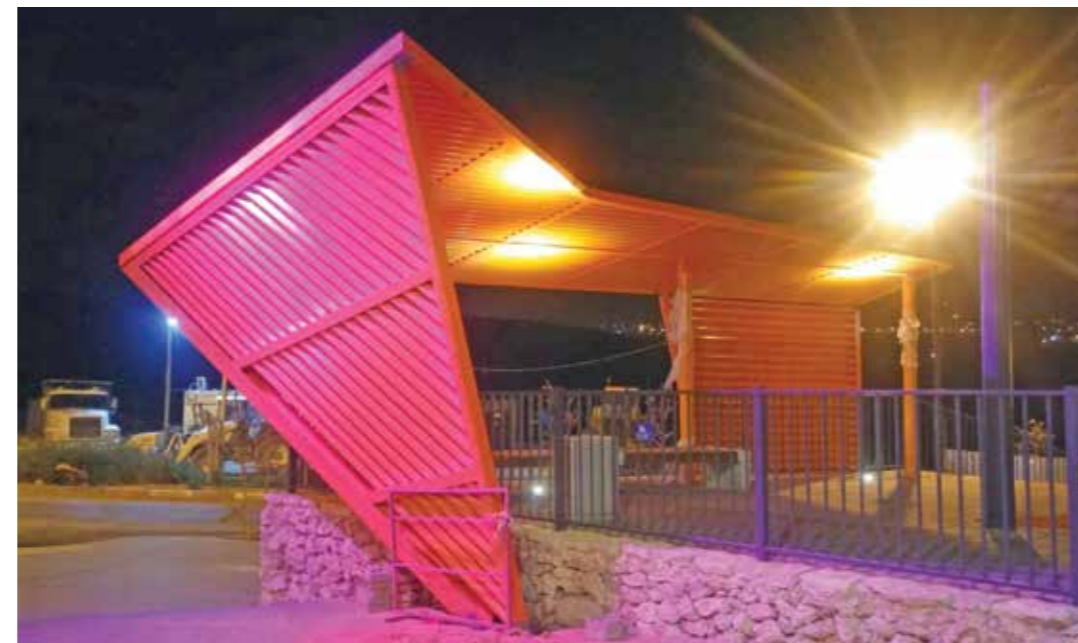
▲ גן הצופה - הדגשה מיחדת - נווה מנחם.